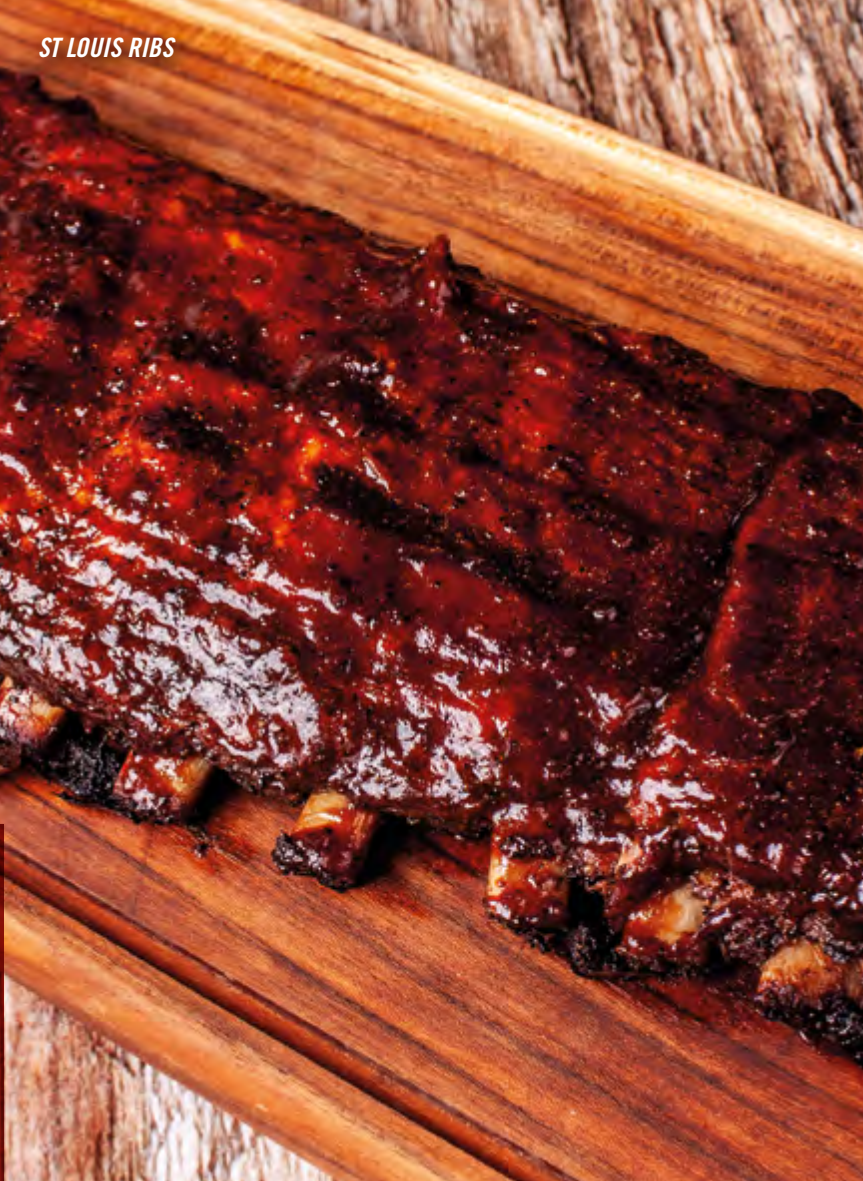
ST LOUIS RIBS