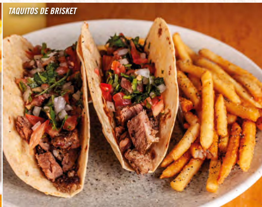
TAQUITOS DE BRISKET