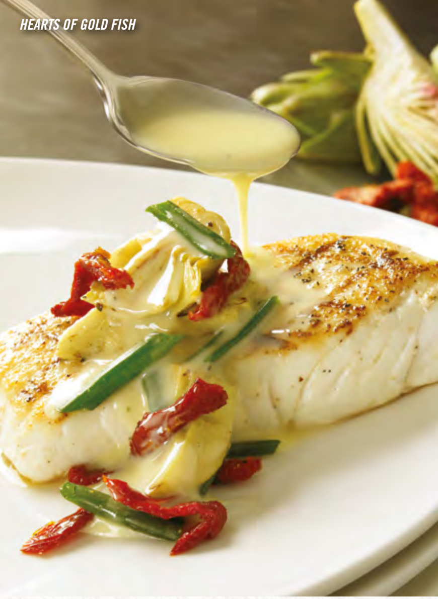
HEARTS OF GOLD FISH