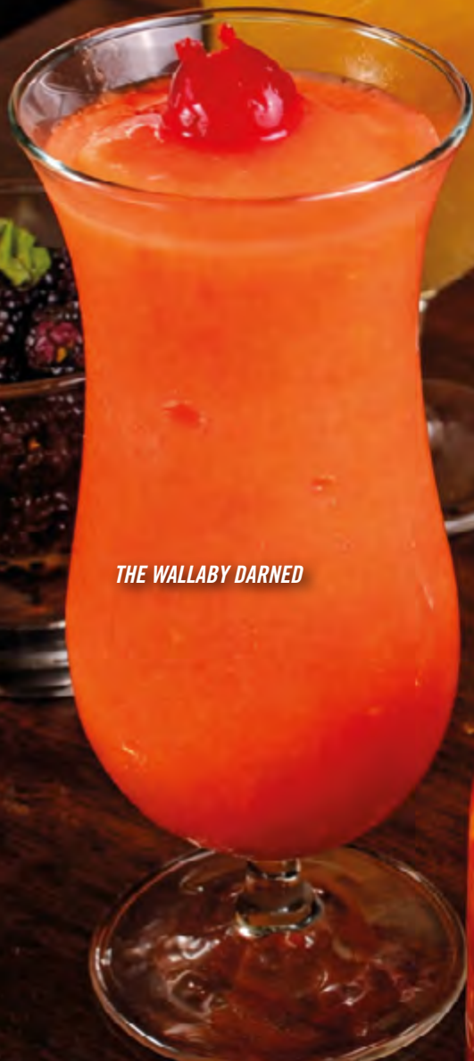
THE WALLABY DARNED