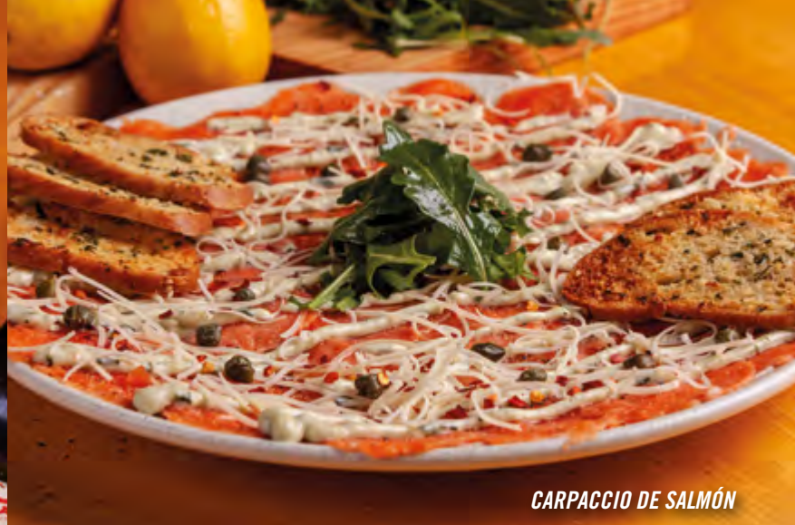
CARPACCIO DE SALMÓN