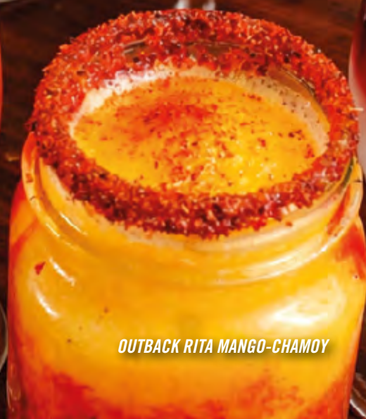
OUTBACK RITA MANGO-CHAMOY