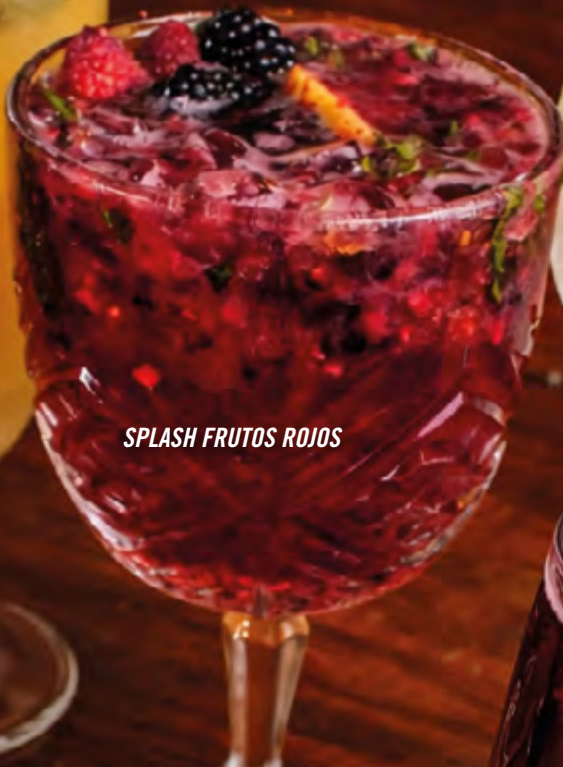
SPLASH FRUTOS ROJOS