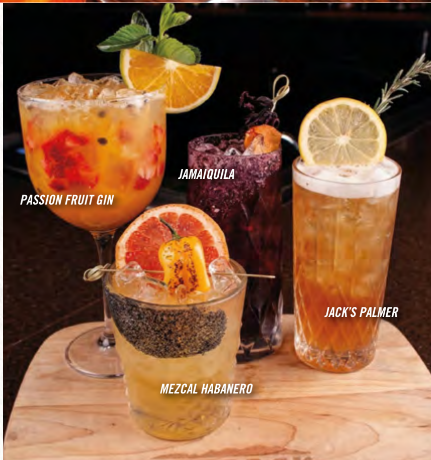
PASSION FRUIT GIN

Deliciosa combinación a base de ginebra, maracuyá, hierbabuena, fresa y limón. Mezclado con agua mineral. Decorado con una rodaja de toronja, con un toque ahumado en tu mesa con canela. (455 ml.). $189