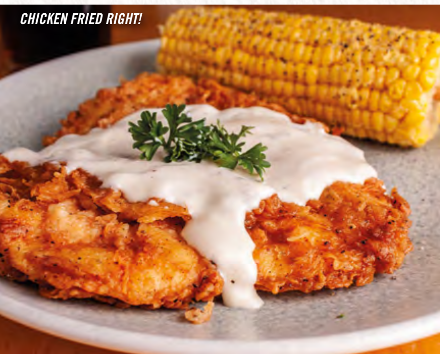
CHICKEN FRIED RIGHT!

Prueba nuestros dos deliciosos tacos de brisket, servido con pico de gallo y papas fritas. $229