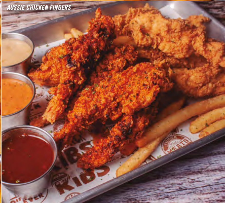
Aussie Chicken Fingers