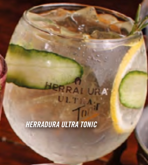
HERRADURA ULTRA TONIC