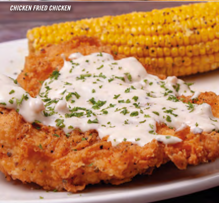
Chicken Fried Chicken