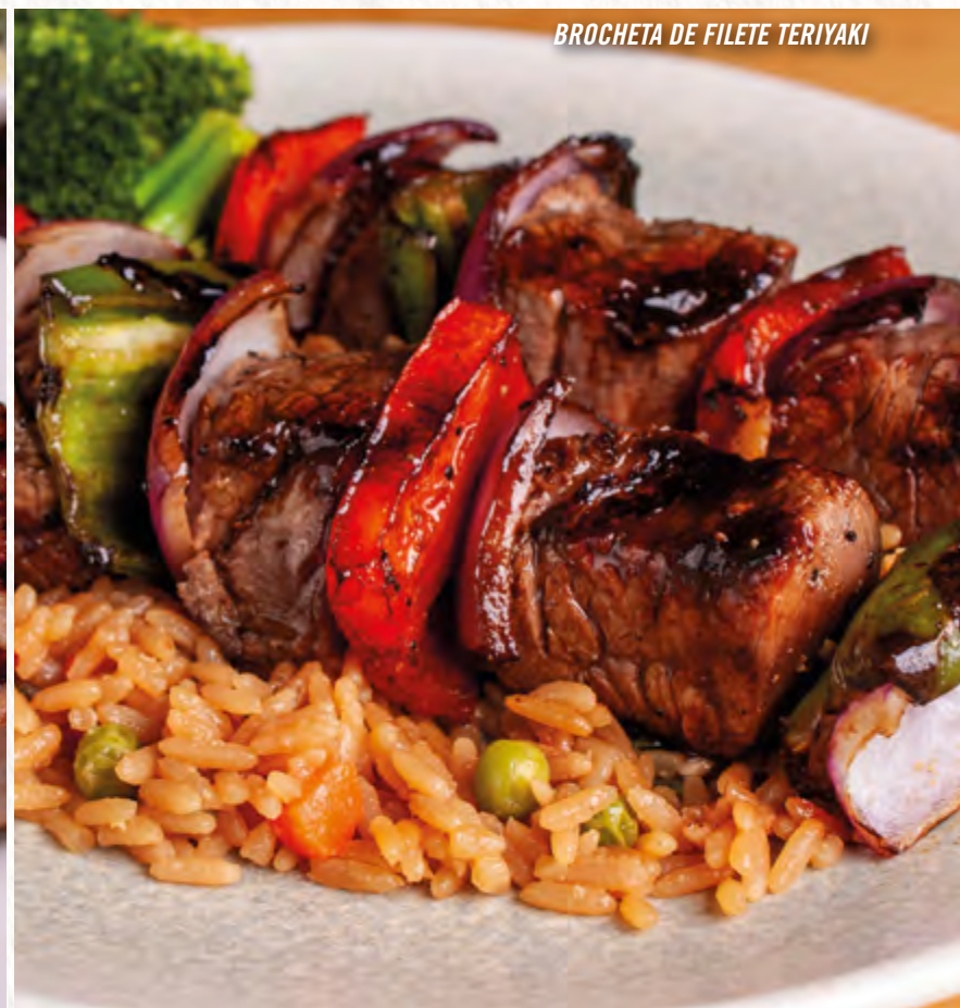
BROCHETA DE FILETE TERIYAKI