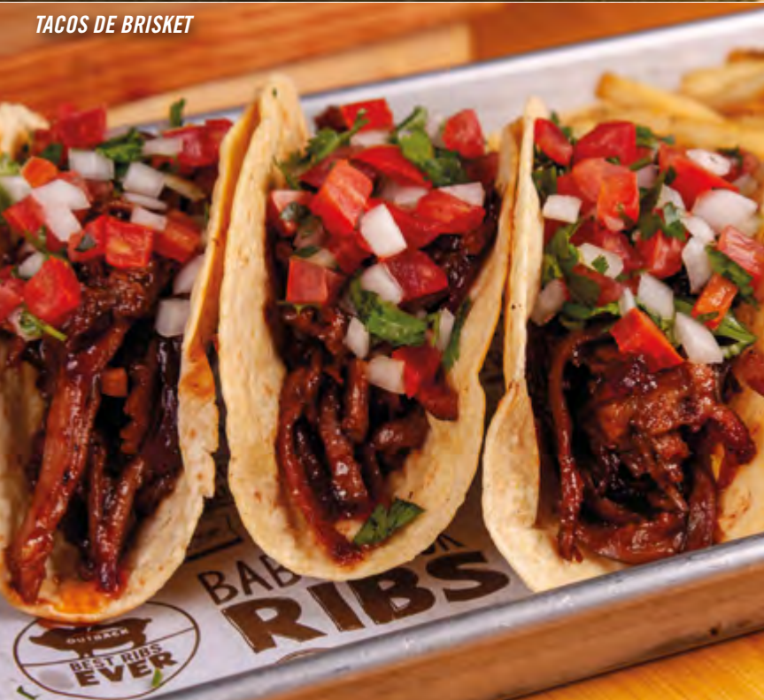
Tacos de Brisket