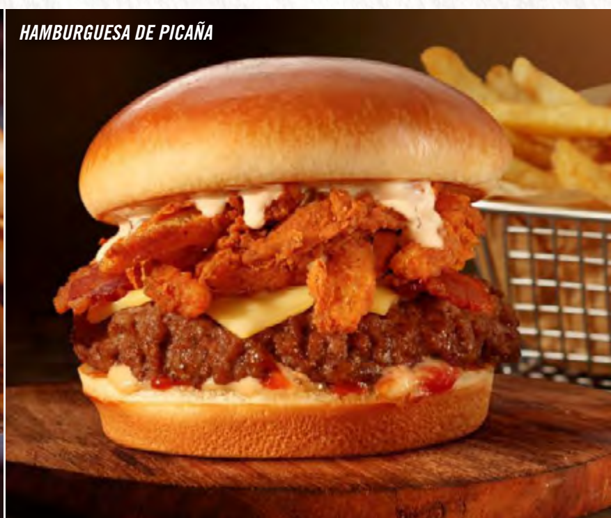
HAMBURGUESA DE PICAÑA