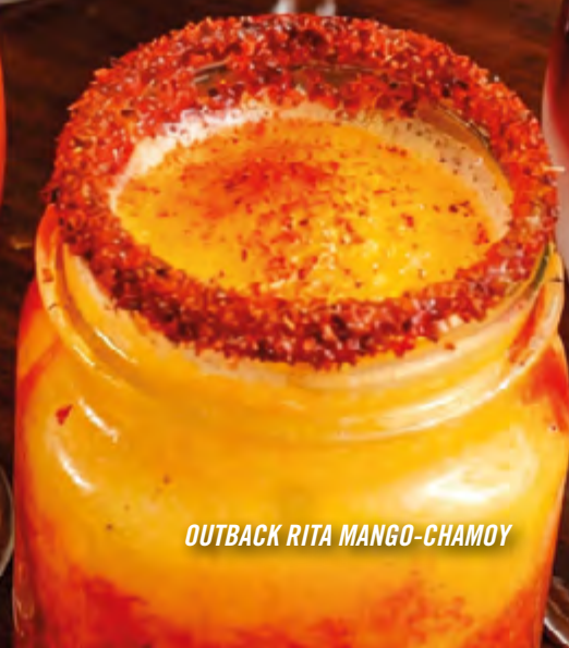
OUTBACK RITA MANGO-CHAMOY